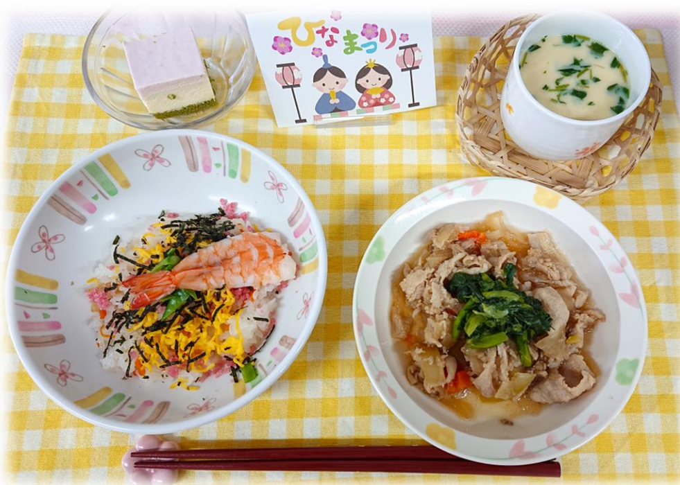
ちらし粥 / キザミ食