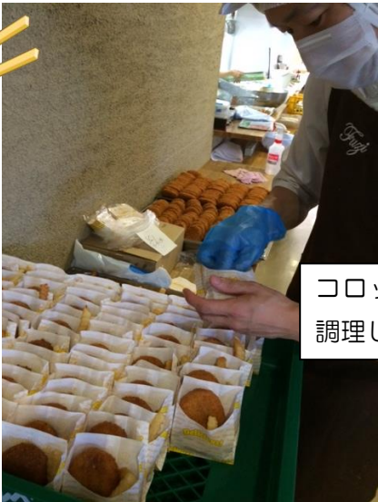
コロッケとポテトを中庭で調理しているところです