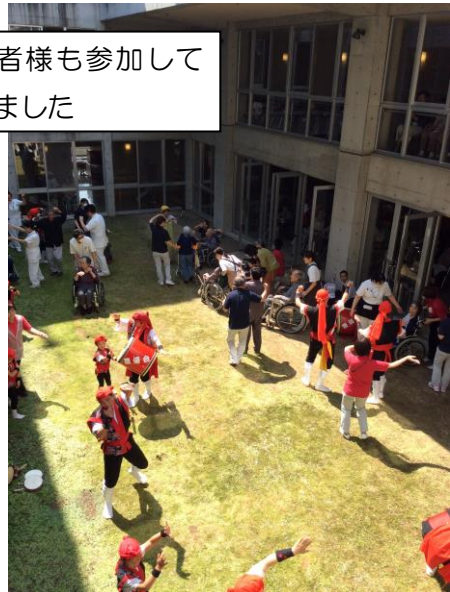
利用者様も参加して 踊りました