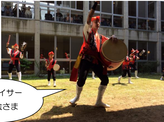
豊中エイサー 豊優会さま